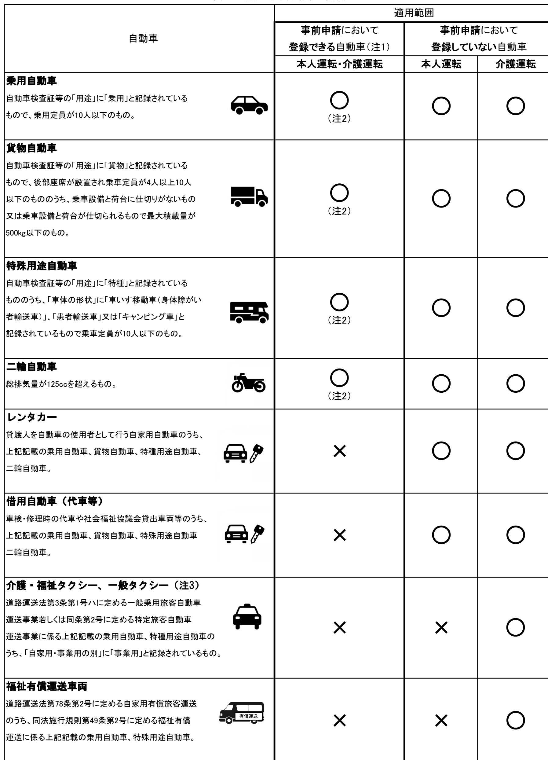
表-1 対象となる自動車一覧表