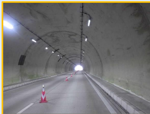
切山トンネル 下りトンネル